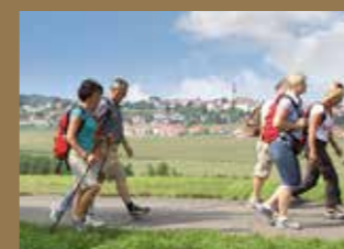
14. Sept: Genusswandertag am Kirchbergvital-Weg