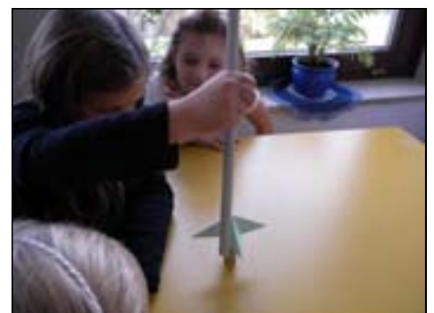
Der Stern soll sich drehen