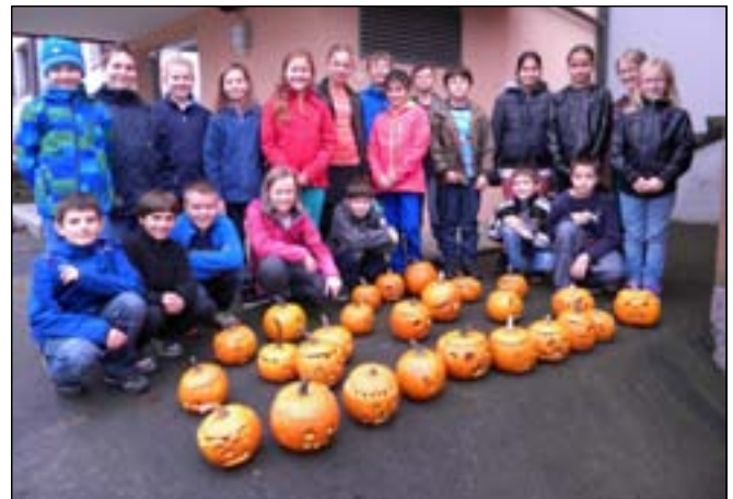
Die 4a mit ihren Produkten

Passend zum Thema Halloween durften einige Klassen der Volksschule am Kürbisschnitzen teilnehmen. Am 31. Oktober fand nämlich eine Halloweenveranstaltung in Berndorf statt. Dafür sollten die Schüler Kürbisgesichter schnitzen, um für die nötige Stimmung zu sorgen. Die zweiten Klassen höhlichten die Kürbisse mit Hilfe von Eltern aus. Die höheren Klassen ließen ihrer Kreativität freien Lauf und schnitzten Gruselgesichter und verzierten die Kürbisse. Die Kinder hatten großen Spaß dabei.