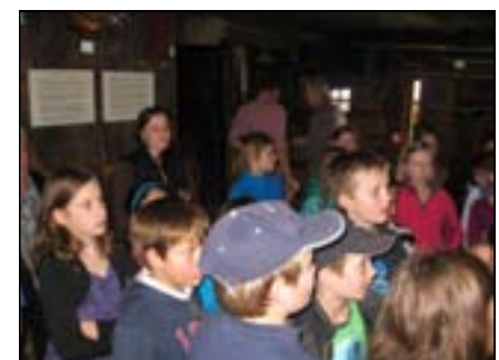
In Peter Roseggers Geburtshaus