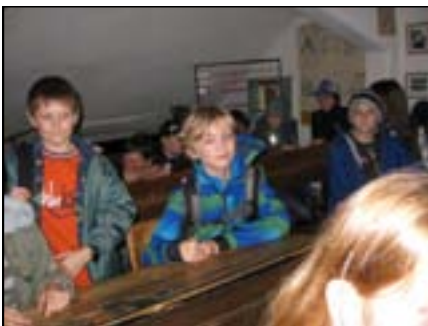
In der Waldschule

Die Kinder der vierten Klassen machten am 15. Oktober einen Ausflug aufs Alpl zur Waldheimat Peter Roseggers. Bereits um 9 Uhr kamen wir bei der Waldschule an, wo wir eine tolle Führung bekamen. Wir lernten etwas über die Schule, wie sie früher war und auch über Peter Rosegger selbst konnten wir viel erfahren. In einer alten Schulklasse wurden uns einige Gedichte und Interessantes über den Dichter vortragen. Das gefiel uns allen gut. Weil wir so ein schönes Wetter hatten, konnten wir den Erlebniswanderweg bis hinauf zum Kluppeneggerhof besonders genießen. Wir stärkten uns mit einer leckeren Suppe. So konnten wir der Führung durch das Geburtshaus entspannt folgen. Auf dem Weg zurück zu unserem Bus sangen wir noch einige Lieder und genossen die frische Almluft. Um 16:15 Uhr kamen wir ziemlich müde, aber trotzdem erfreut, wieder bei unserer Schule an, wo uns unsere Eltern abholten. So ein Lerntag im Freien ist schon etwas Tolles.