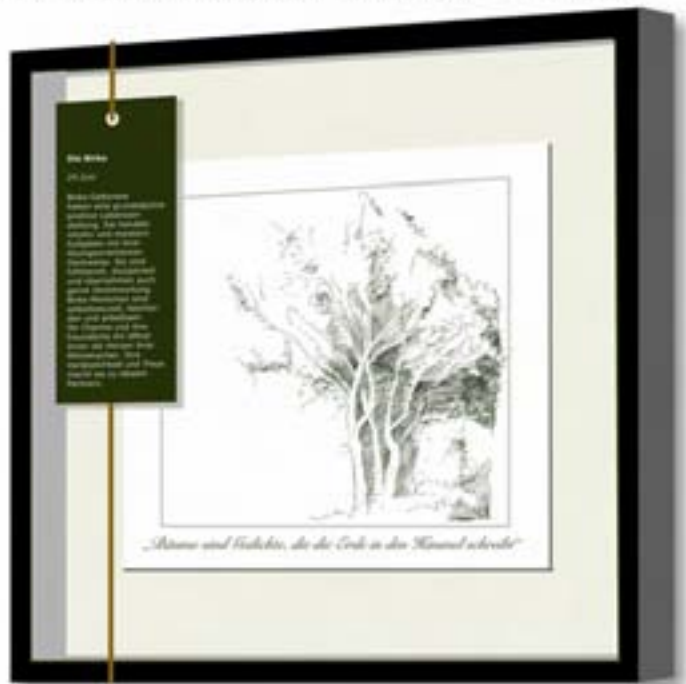
Größe 25/25 cm