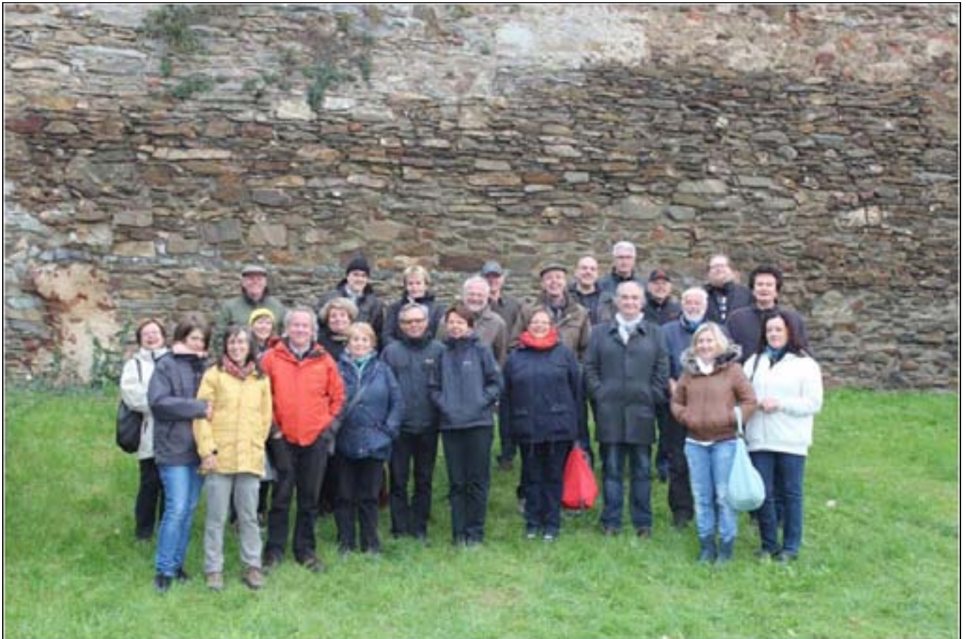
Die Kirchberger Historikerrunde vor den ehrwürdigen Stadtmauern von Kőszeg.