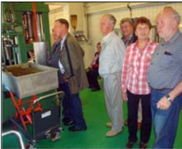
Besichtigung der Ölmühle Neuhold in St. Nikolai o.D.

Besonders gefallen mir die gemeinsamen Ausflüge, die Hilfe für ältere Menschen, ganz einfach die Gemeinschaft innerhalb des Seniorenbundes.