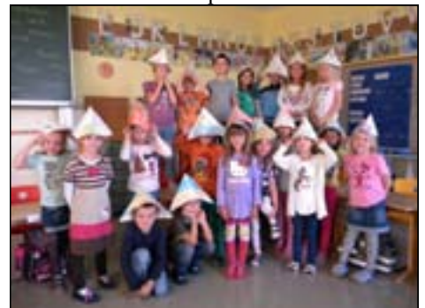
HH mit gefaltetem Hut

Die Lesepatenschaft mit der 3. Klasse zaubert jeden Morgen ein Lächeln auf die Gesichter der kleinen „Lesemäuse“, die schon sehnsüchtig auf ihre „Bücherwürmer“ warten und sich freuen, wenn ihnen aus ihrer Trainingskarte ein gelber Smiley entgegenlacht (weil ihr Bücherwurm mit ihrem Fortschritt zufrieden ist). Und die Großen kümmern sich liebevoll um ihre Schützlinge und helfen ihnen so gut es geht.