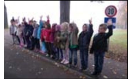
Kinder achten auf den Straßenverkehr

Kinder hören aufmerksam zu. Kinder der ersten Klassen sind hier sehr engagiert und eifrig bei der Sache. Mit den 2. Klassen werden neuralgische Verkehrsstellen im Schulort besucht und Gefahren besprochen. Die 3. Klassen sind in die Polizeiinspektion Kirchberg an der Raab eingeladen, um Einblick in die Arbeit der Polizei zu gewinnen. Ihnen werden Aufgaben gestellt und am Ende erhalten sie die Mitgliedsurkunde der Kinderpolizei.